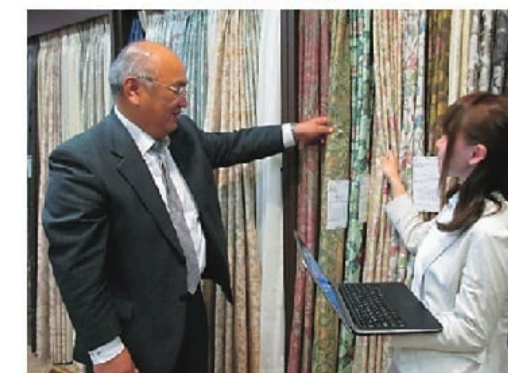
生地の選定・提案