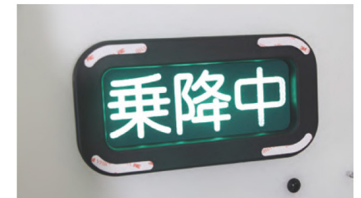
ユニバーサルタクシーに取り付けられる乗降中のライト

納入先への申請、承認などを経て、補助事業終了翌年から本格稼働している。効率化、人員の適