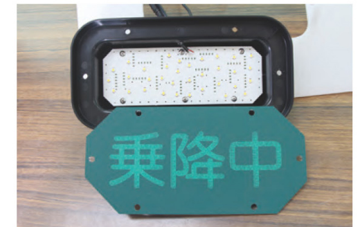
内部の電子基板は基板実装機と自動ハンダ印刷機を使って製作した