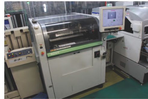
自動ハンダ印刷機SONY SI-P850。基板実装機と並んで設置されており、部品が載った状態の基板が自動的に入る