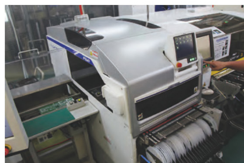
電子基板の上に高速・高精度に電子部品を装着する基板実装機FUJI NXT III

浮いた人員は、ユーザーとのやり取りなどの人にしかできない仕事を任せ、細かな依頼にも対応できる体制づくりの強化を図った。