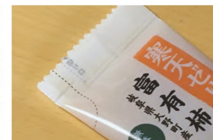
便利カット形状にした切り口