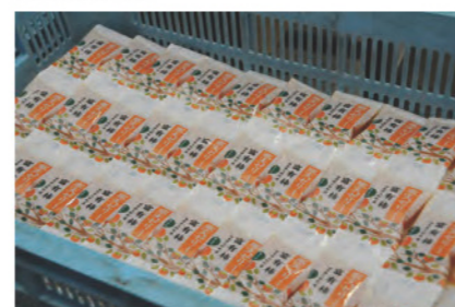
地元の特産とコラボレーションして商品開発を進めた