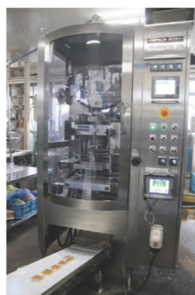
新たに導入した高速汎用性袋充填機ONP-2030AS3

その上で、オリジナルカップに代わる革新的な包装形態の新規商品開発ならびにラインの自動化・高度化を図るために「高速汎用性袋充填機ONP-2030AS3」と「300Lパステライザー」を導入した。20gから2,000gまで対応できる汎用性を考