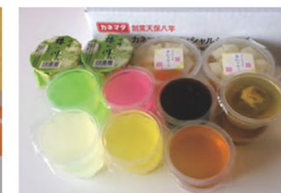
これまでのカップ商品