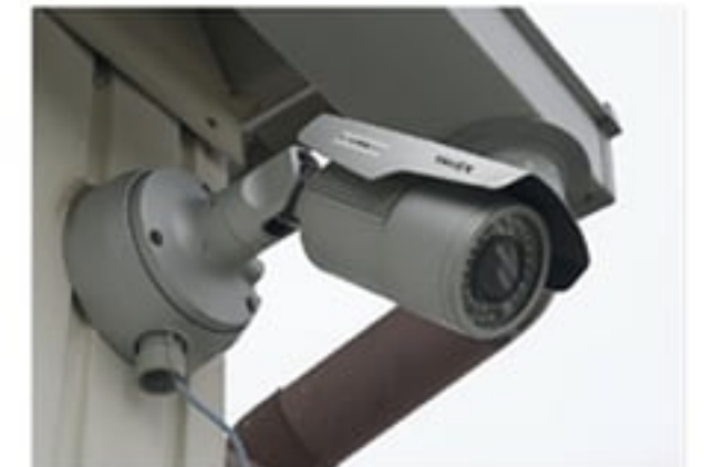
NETカメラは、コース内4カ所に8基設置

教習中もコース内に設置したNETカメラが撮影した運転の様子を俯瞰して見ることで、S字やクランクなど難易度の高い場所の運転方法も理解度が増した。アンケートの結果、導入前には78.6点だった教習効果が92.6点となり、充実した教習内容に生徒の満足度が高まった結果となった。