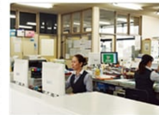
教習の受付がスマートフォンでできることで、事務手続きの業務が軽減

本事業では、新たな自動車教習システムと専用アプリの設計・開発に取り組み、生徒のスマートフォンとの相互連携システムを採用。卒業までの全講習やバス乗車の予約、指導員から生徒へメッセージやアドバイスの送付、生徒の声を確認するアンケートフォームなどのシステムを導入した。また教習コースにNETカメラを設置し、車内からタブレットで運転状況を把握できるようにした。両システムは、シミュレーションや運用テストを実施し、業務の効率化実践度を測定したほか、アンケート結果から教習効果を測定した。