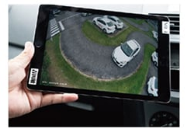
NETカメラで撮影した映像をリアルタイムに確認しながら、車内の指導員が的確に指導